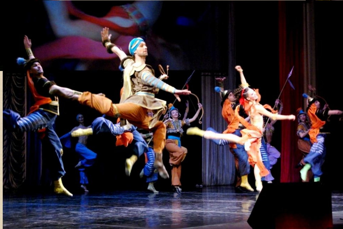
Сцена половецких плясок