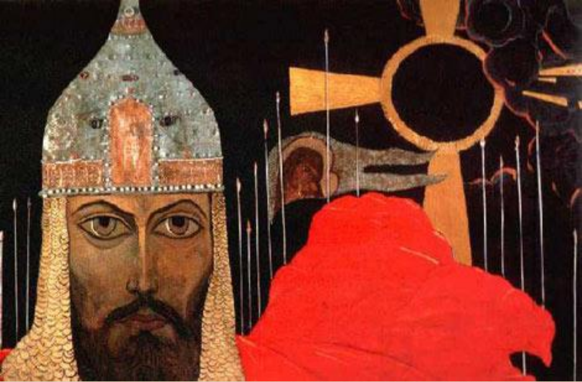
И.Глазунов «Князь Игорь»