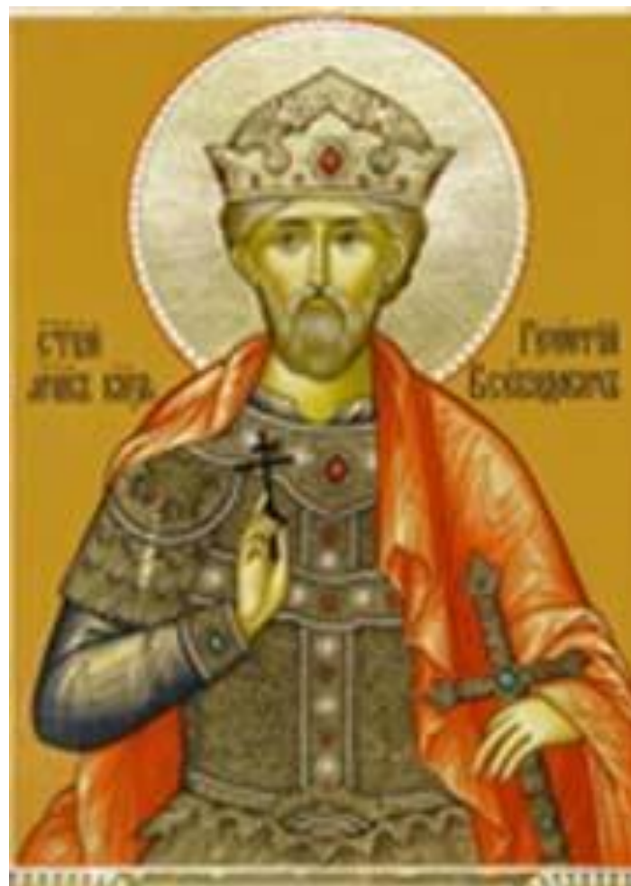
Георгий (Юрий) Всеволодович