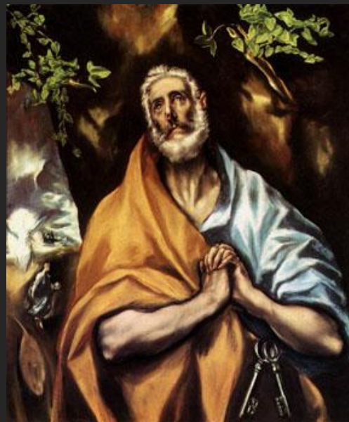
Эль Греко. Раскаяние святого Петра. 1605

Количество ключей у святого Петра – это метафора, с помощью которой творцы искусства пытаются подсказать нам, что путь в райские кущи не один.