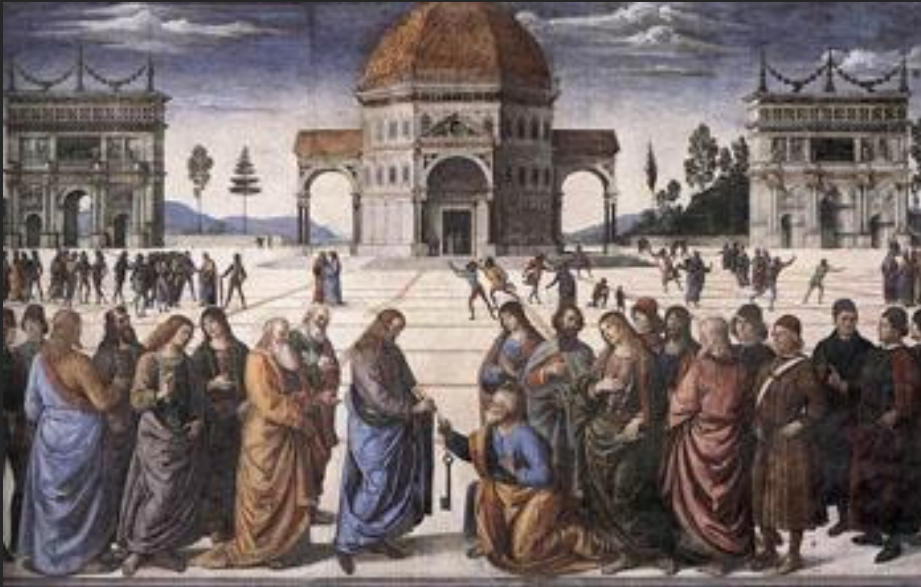
П. Перуджино Передача ключей апостолу Петру 1482

Количество ключей у святого Петра – это метафора, с помощью которой творцы искусства пытаются подсказать нам, что путь в райские кущи не один.