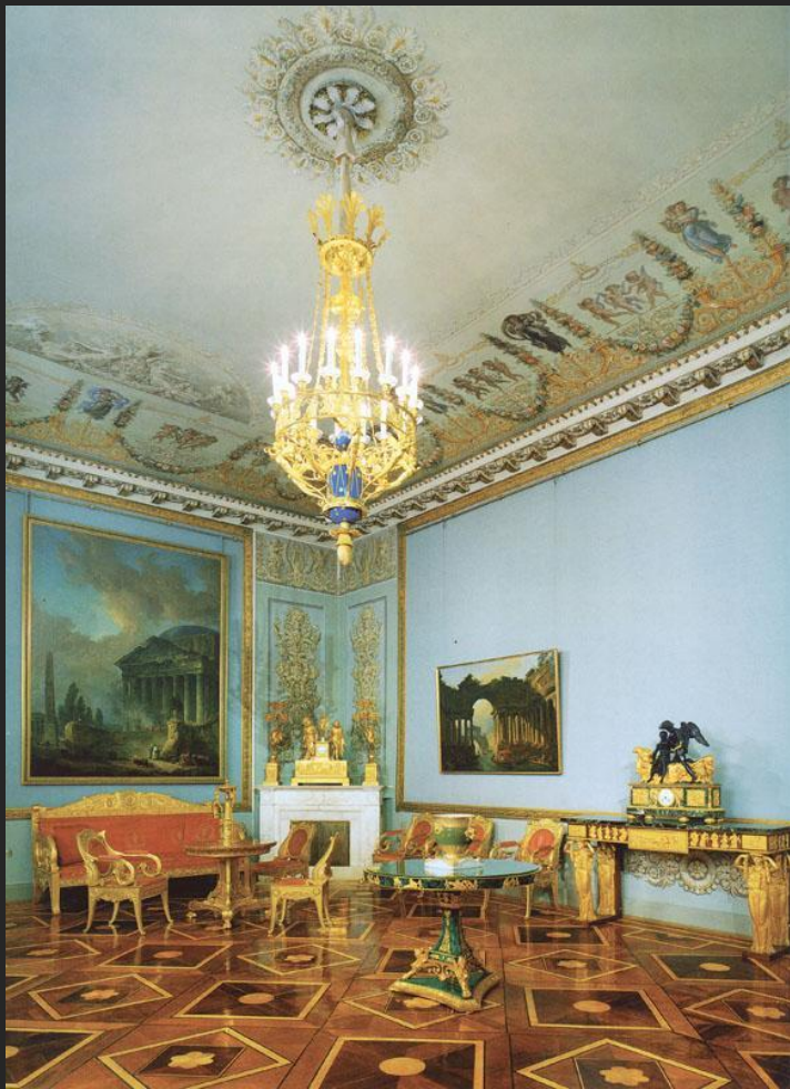
К. Росси. Генеральный штаб. Жилые апартаменты К. Нессельроде. 1823

Группа 2. Музейное пространство (выставка «Под знаком орла. Искусство ампира» в Государственном Эрмитаже)