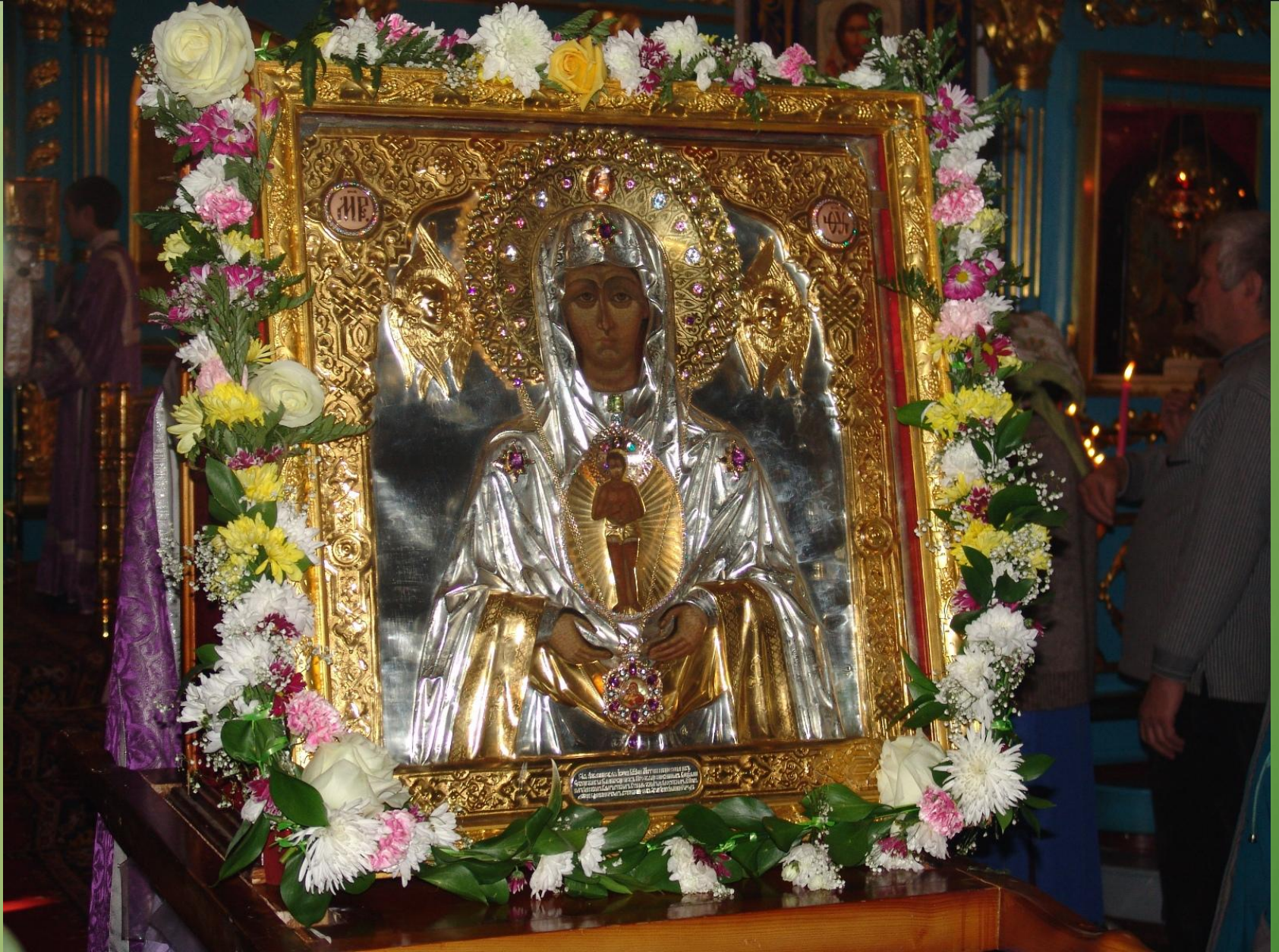
Икона Божией Матери «Слово Плоть Бысть»