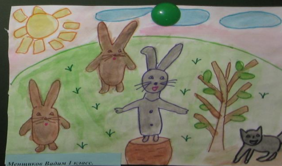
Мещников Вадим 1 класс.

Рисунки по мотивам любимых книг являются для ребенка одним из способов выражения своих впечатлений от произведений.