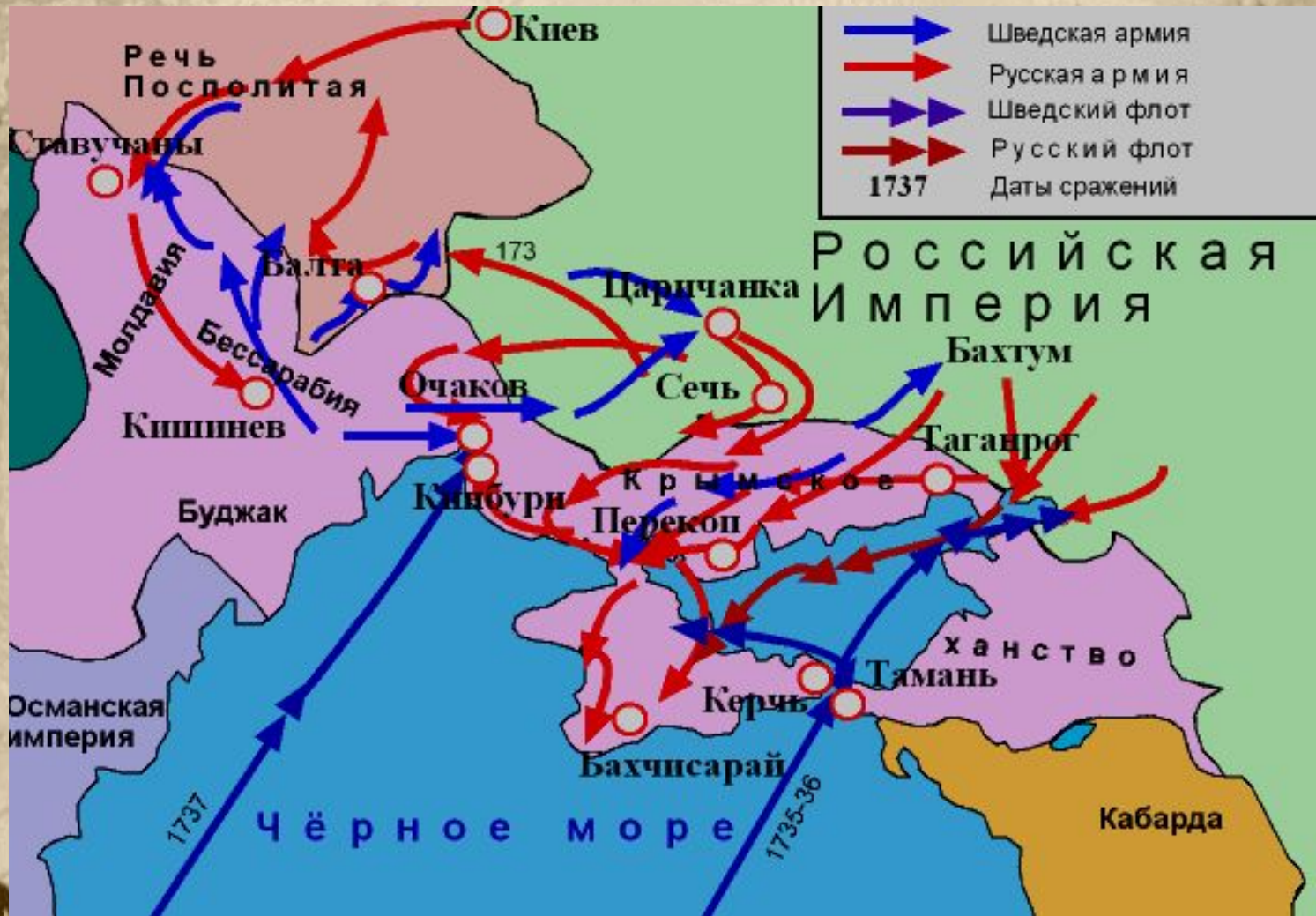
Карта русско- турецкой войны