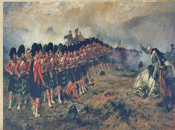
„Тонкая красная линия“

★ 2 (14) сентября 1854 года началась высадка экспедиционного корпуса коалиции в Евпатории. Командование Черноморского флота собиралось атаковать вражеский флот, чтобы сорвать наступление союзников. Однако Черноморский флот получил категорический приказ, в море не выходить, а оборонять Севастополь с помощью матросов и корабельных пушек.