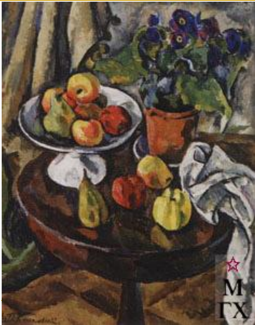
«Натюрморт с фруктами»