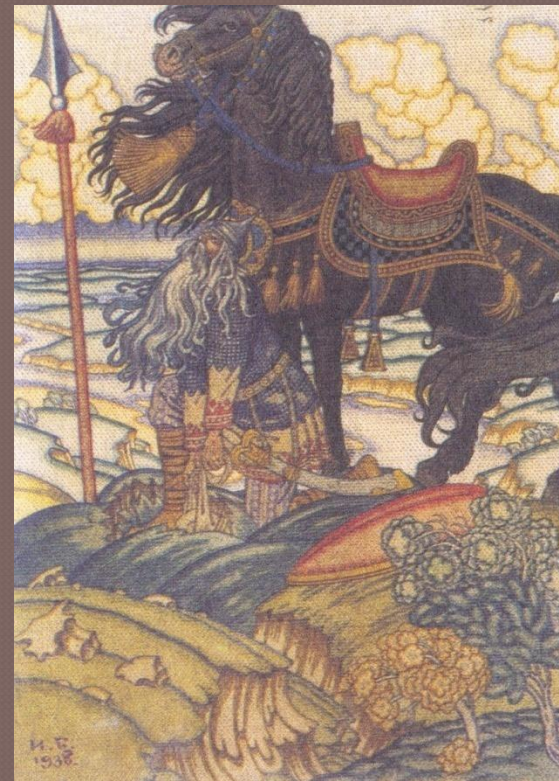
Святогор и перемётная сума