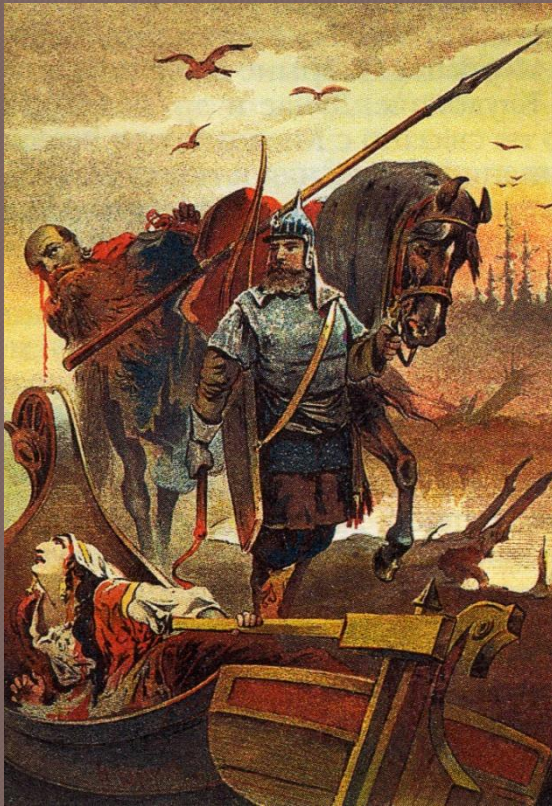
Илья Муромец и Соловей-разбойник