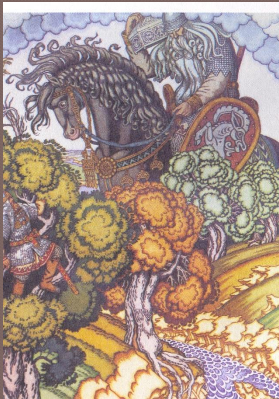
Святогор и Илья Муромец