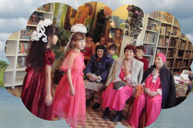
Библиотека филиал № 6 с. Новый завод