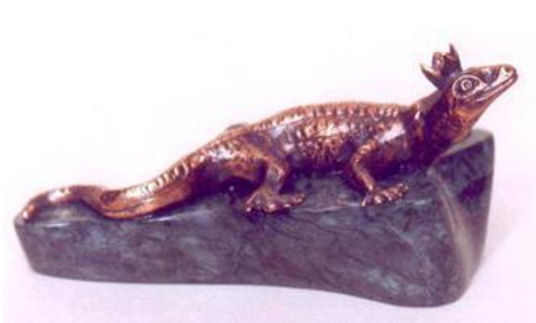
Хозяйка Медной горы, бронза. А.Н. Четвериков