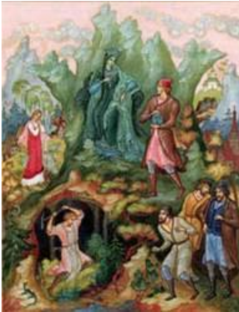
«Медной горы Хозяйка» К. Кукулиева

Динамику сюжета составляет борьба двух сил: социальной несвободы и демонического влияния Хозяйки.