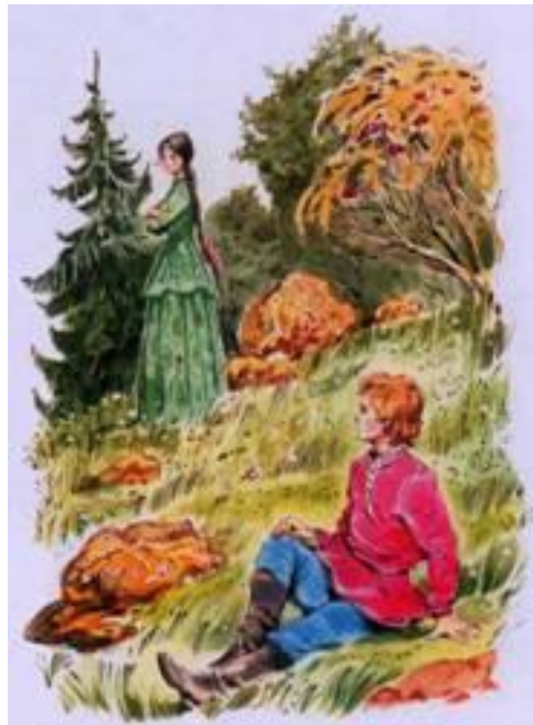
«Медной горы Хозяйка» В. Челак

Хозяйка Медной горы (Малахитница, Хозяйка) владеет подземными богатствами, секретом красоты, контакты с ней заканчиваются печально, поэтому люди её боятся.