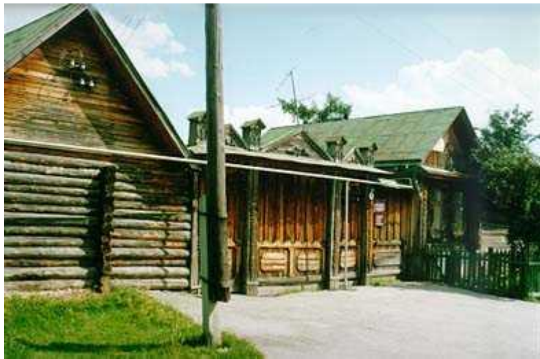
Дом Бажовых, Сысерть