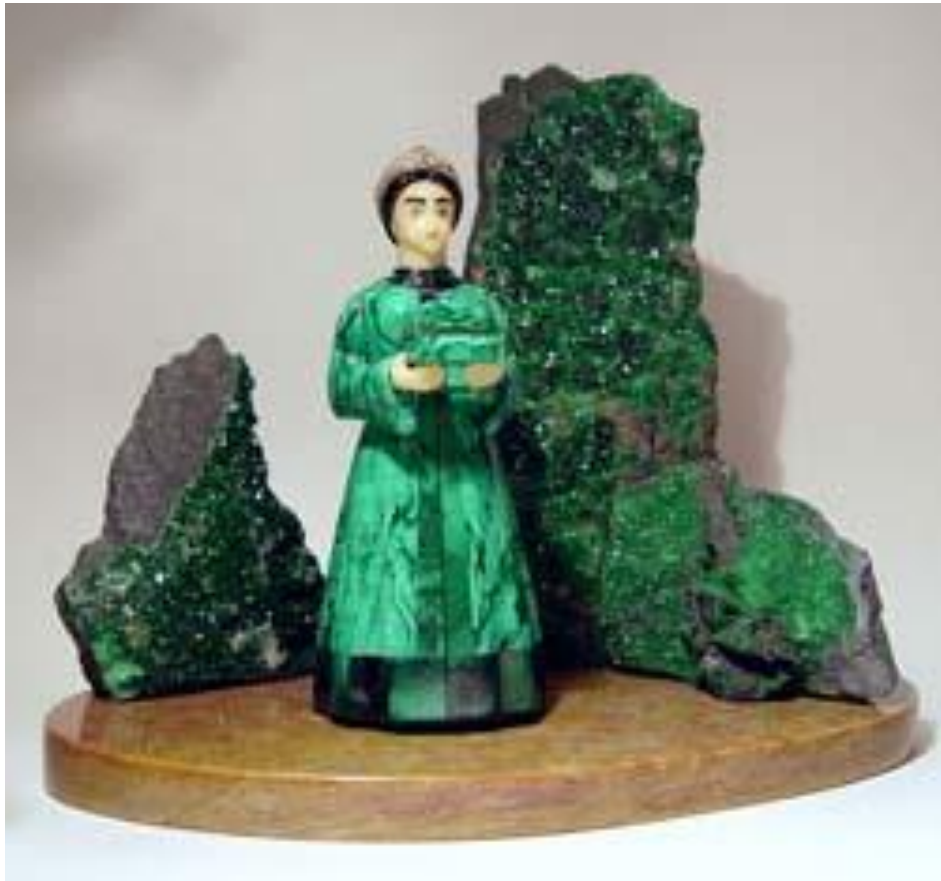
«Медной горы Хозяйка»