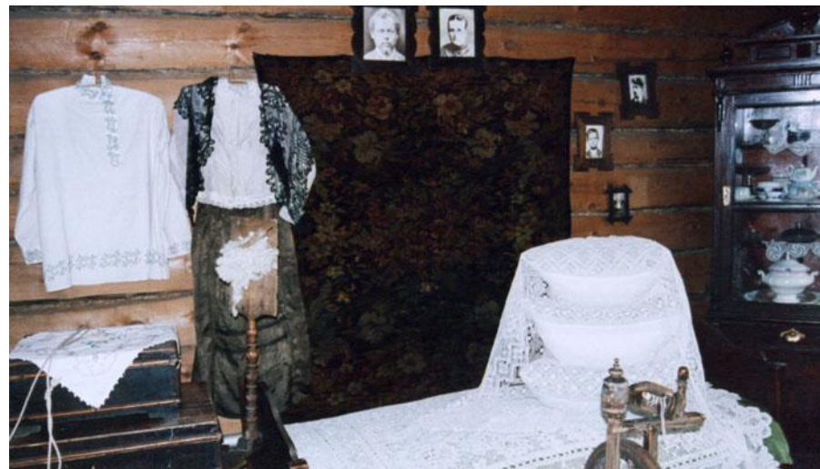
Комната в доме Бажовых, Сысерть

«...Родился 27 января (15 по старому стилю) 1879 г. в Сысертском заводе бывшего Екатеринбургского уезда, Пермской области. Отец по сословию считался крестьянином, но работал на заводе... мать кроме домашнего хозяйства занималась рукоделием «на заказчика».