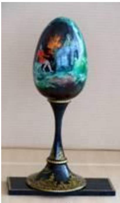
Пасхальное яйцо «Хозяйка Медной горы», дерево. В.А. Панин. Палех, 2003.

Сказы Павла Петровича Бажова так умны и так красивы, что композиторы сочиняют к ним музыку, художники рисуют иллюстрации