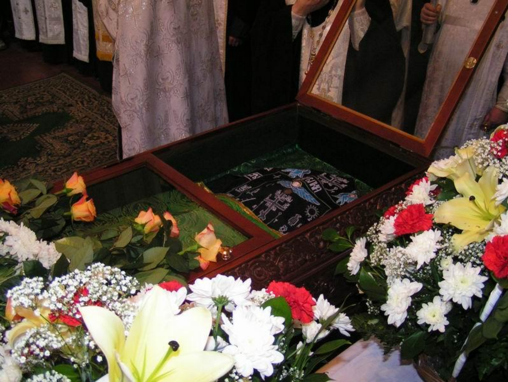
Гатчина. Мощи св. Марии Гатчинской