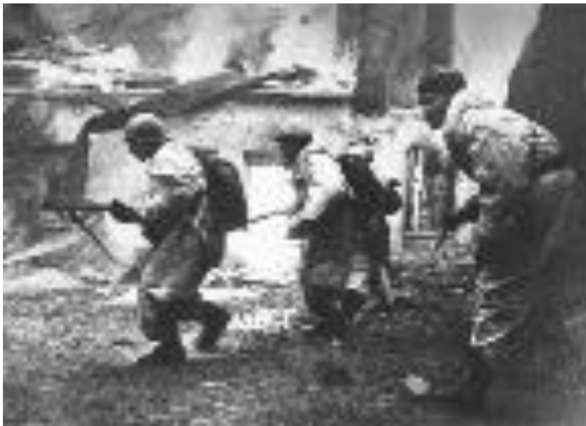
Воины Ленинградского фронта ведут бой в Гатчине

В годы Великой Отечественной войны город был оккупирован немецкими войсками. Дворцово-парковый ансамбль Гатчины был почти полностью разрушен.