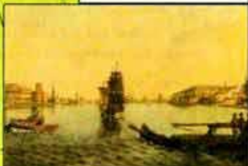
Петербург начала XVIII в. Худ. Е. Лансере