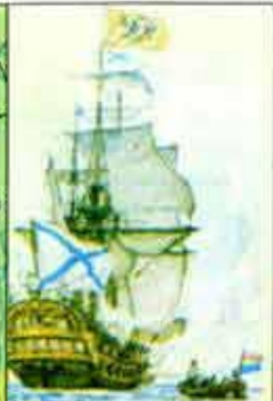
Военный корабль. XVIII век