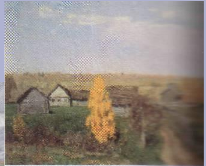
Золотая осень. Слободка.