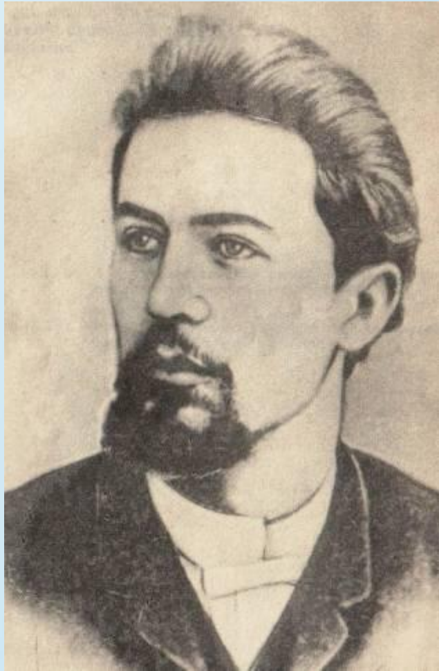
А.П.Чехов. 1891 год

Чехову шел тридцать второй год. Высокий, стройный, с веселым, открытым и необыкновенно симпатичным лицом, он не суетился, не радушичал, не старался во что бы то ни стало казаться остроумным и интересным. Природный ум, привлекательность оборачивались сдержанностью и спокойным тоном, приветливым обращением. Голос – звучный с басовитыми нотками. Быстрый взгляд его чудесных глаз был приветлив и открыт, по-юношески чуть насмешлив. Удостоенный Пушкинской премии Академии Наук, автор серьезных произведений, он все еще сохранял многое от Антоши Чехонте.