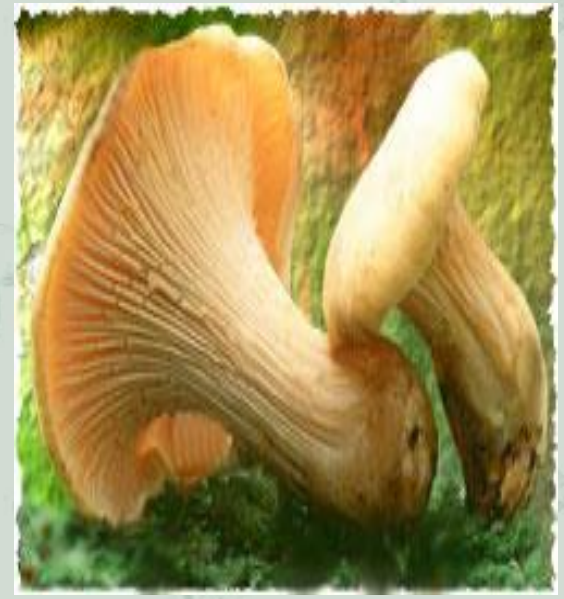
Ядовитый гриб – Ложный опенок