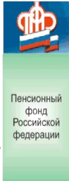
Пенсионный фонд Российской федерации