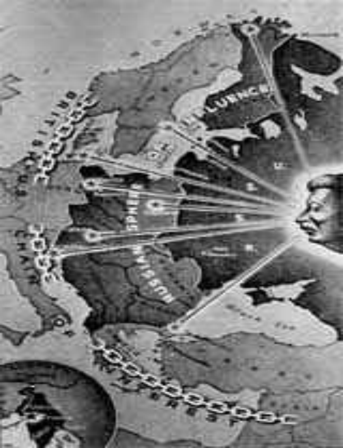
карикатура 1946 г.