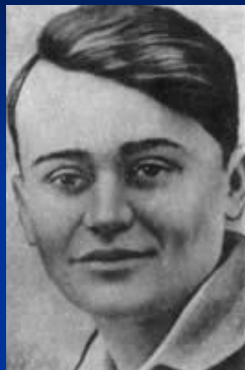
Молодогвардеец Олег Кошевой.