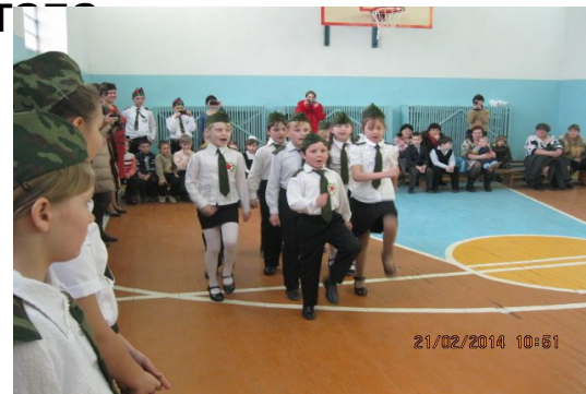
Выступление учащихся 2-4 классов