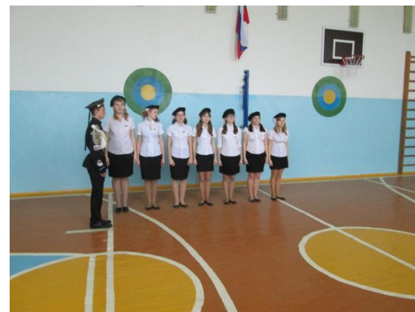
Выступление учащихся 5-11 классов