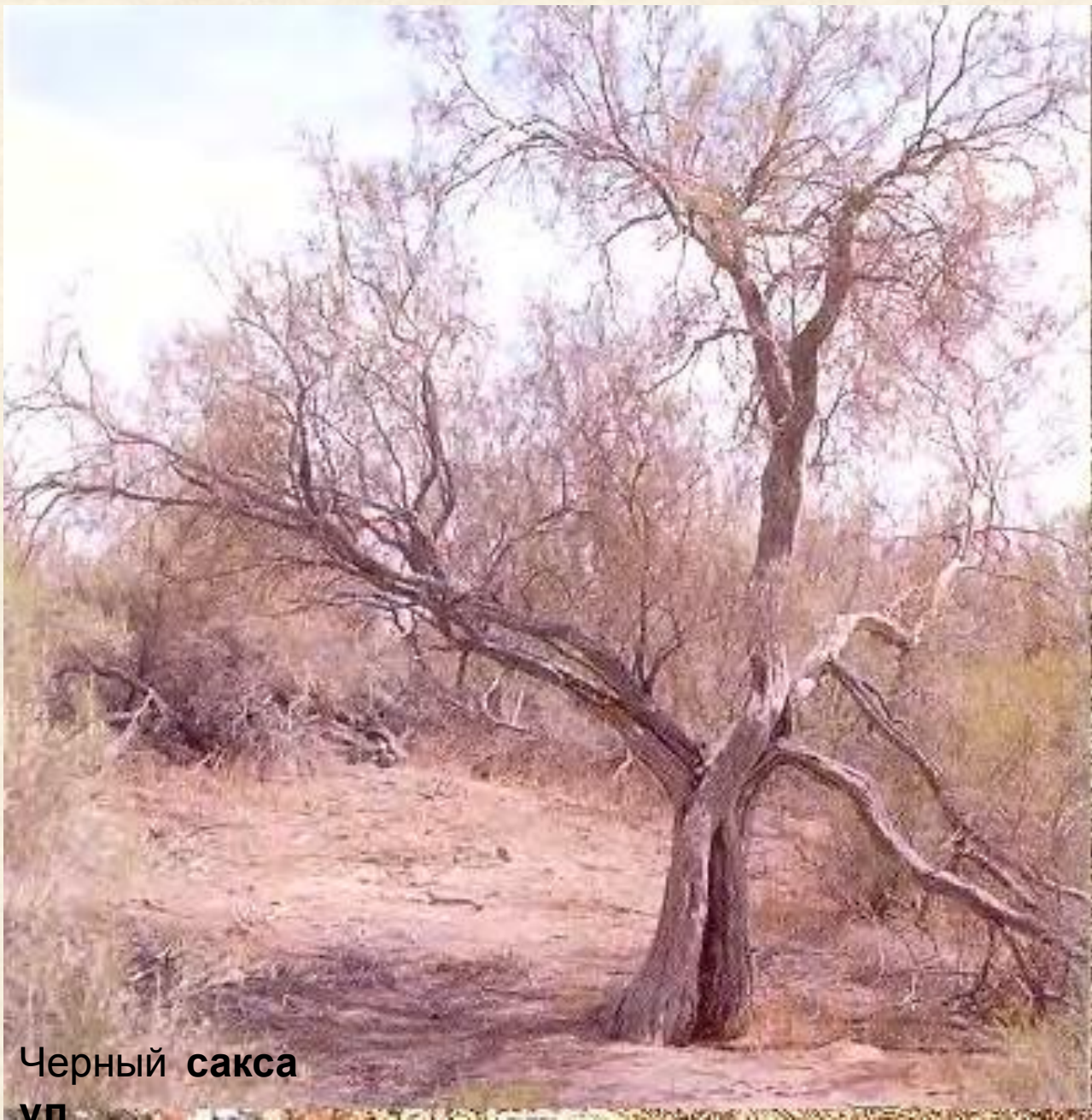
Черный сакса ул