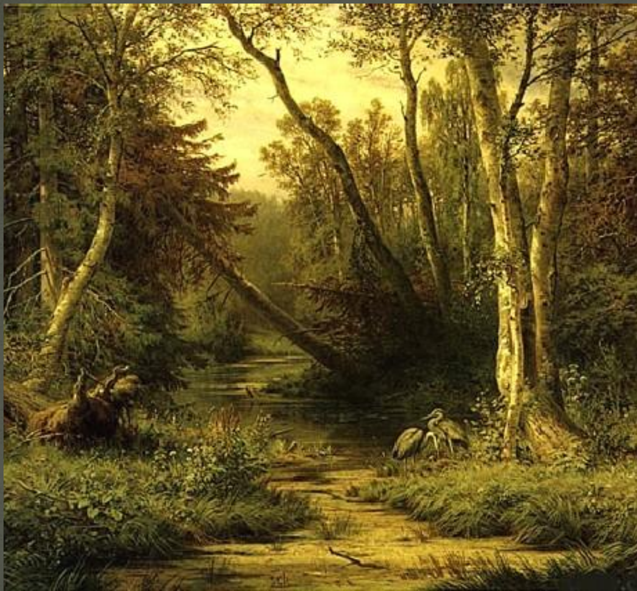
«Лесной пейзаж с цаплями» 1890г