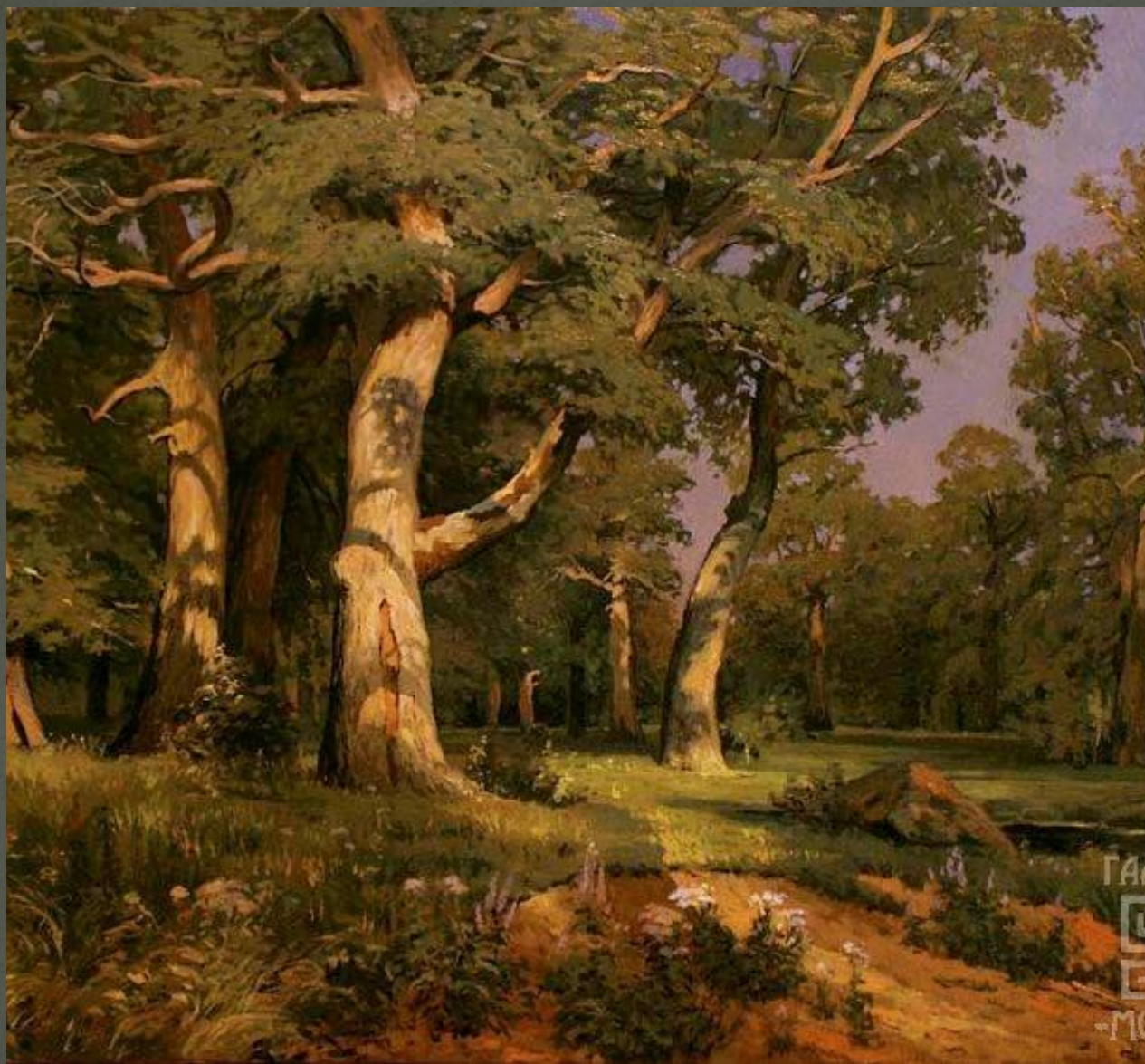
« Дубовая роща»