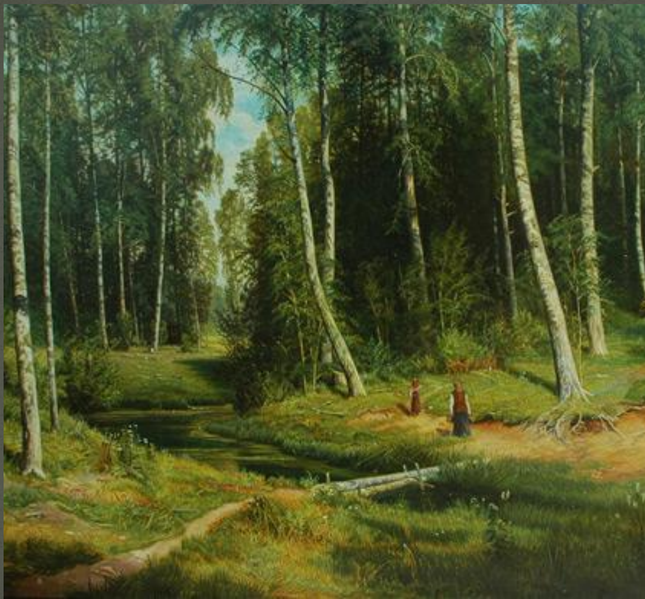
«Ручей в Березовом лесу»