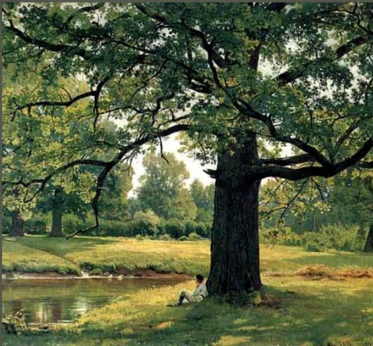
«Дубы в старом Петергофе»