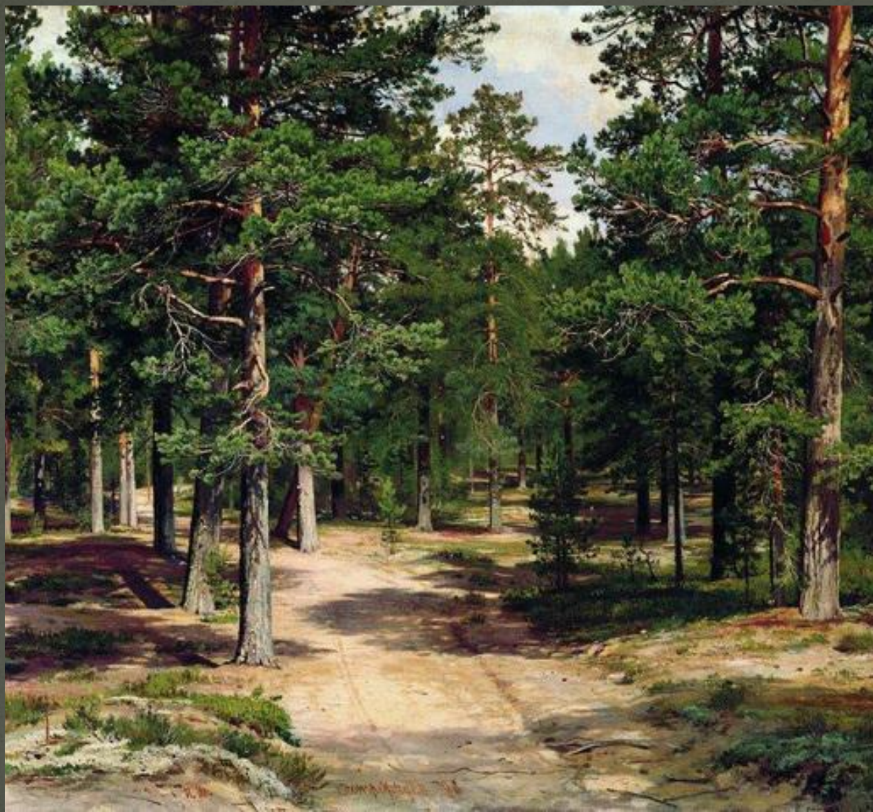
«Сестрорецк ий бор»