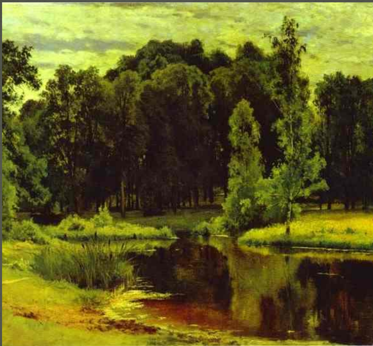
«Пруд в старом парке». 1898