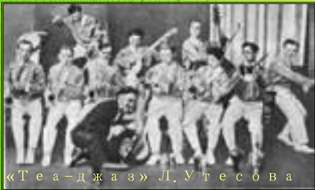
«Т е а - д ж а з» Л. У т е с о в а

собрал музыкантов и стал готовить джазовую программу. 8 марта 1929 года на сцене Малого оперного театра (г. Ленинград) дебютировал театрализованный джаз Леонида Утесова с программой «Теа-джаз».