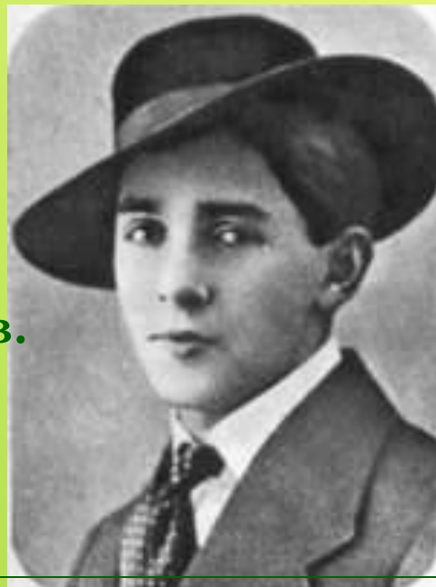
А.Утесов 1911 год

В 1912 году устроился в Кременчугский театр миниатюр; тогда же взял сценический псевдоним Утесов.