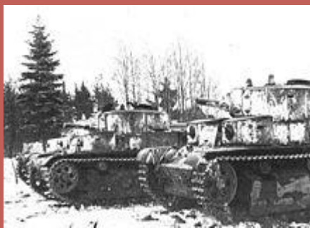
Т-28 на огневом рубеже. Карелия, январь 1940 года