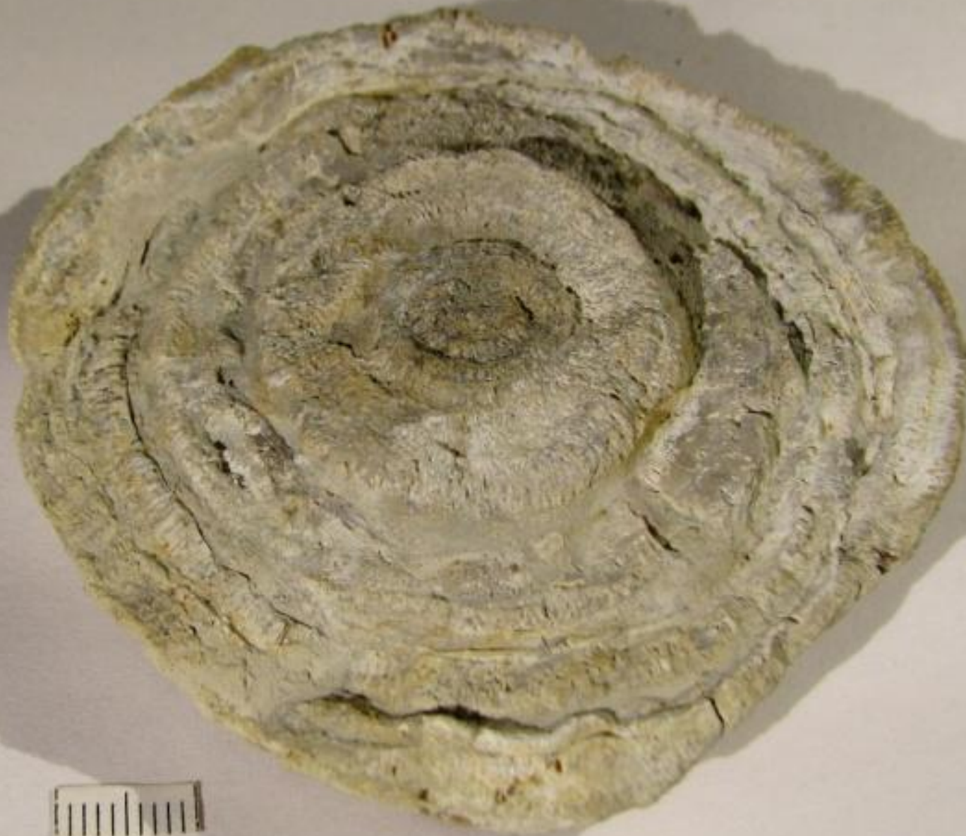
Крупная мшанка ордовикского периода.