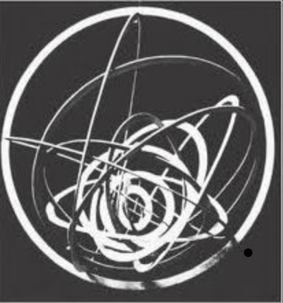
А. Родченко. Мобили