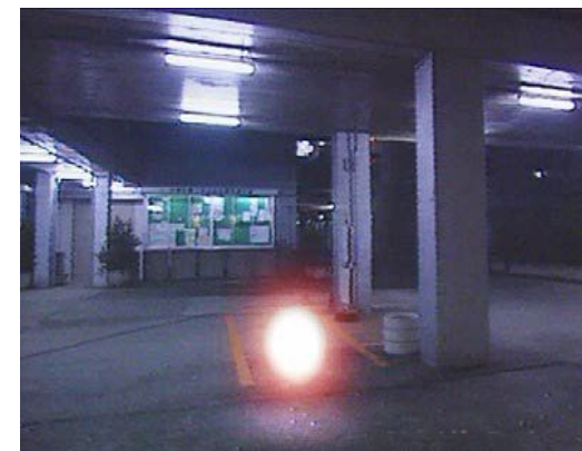
Единственный существующий сейчас «шаромолниеотвод»

Если же шаровая молния задела кого-то и человек потерял сознание, то его необходимо перенести в хорошо проветриваемое помещение, тепло укутать, сделать искусственное дыхание и обязательно вызвать скорую помощь. Вообще же, технические средств защиты от шаровых молний как таковых пока не разработано.