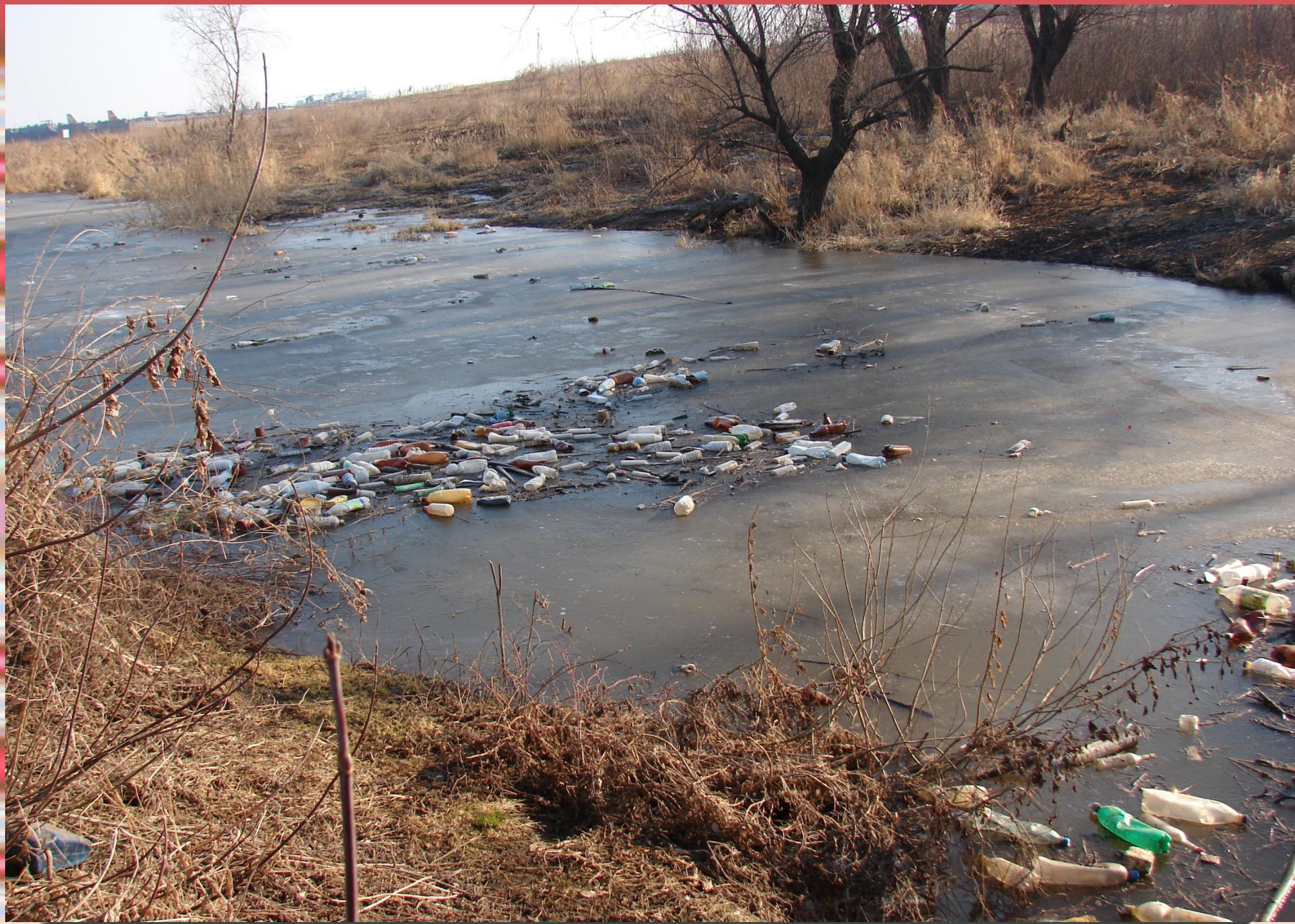
Состояние реки Берняжка (апрель 2009 год)