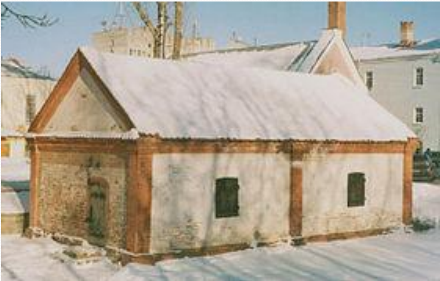
Кузница — самое старое светское здание города Смоленска.