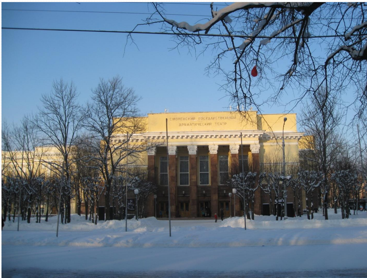
Смоленский государственный драматический театр имени А.С. Грибоедова.