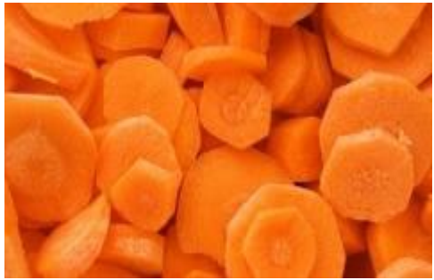
резаная ..... масло