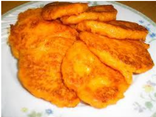
..... оладьи цвета