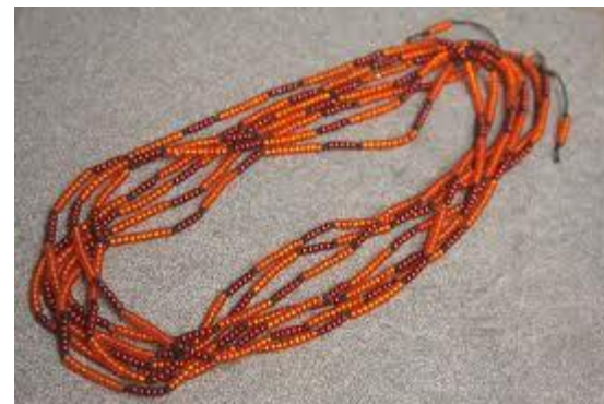
бусы морковного цвета