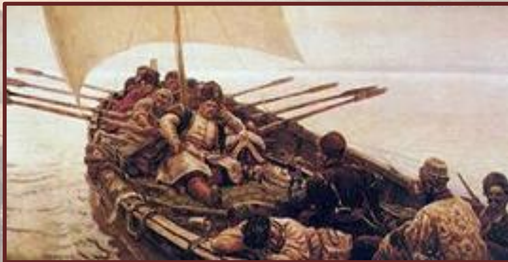
Василий Суриков. «Степан Разин»

К восстанию Степана Разина часто относят так называемый «Поход за зипунами» (1667—1669) — поход повстанцев «за добычей». Отряд Разина блокировал Волгу и тем самым перекрыл важнейшую хозяйственную артерию России. В этот период войска Разина захватывали русские и персидские купеческие корабли. Получив добычу и захватив Яицкий городок, летом 1669 года Разин двинулся к Кагальницкому городку, где стал собирать свои войска. Когда собралось достаточно людей, Разин заявил о походе на Москву.