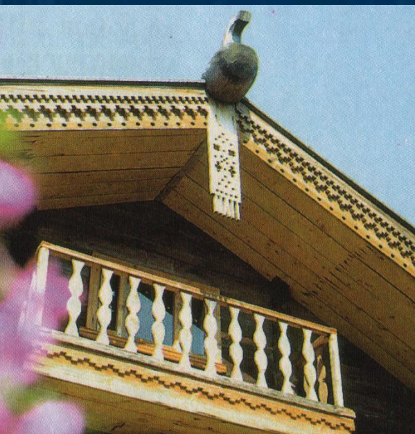
Балкончик с резным ограждением