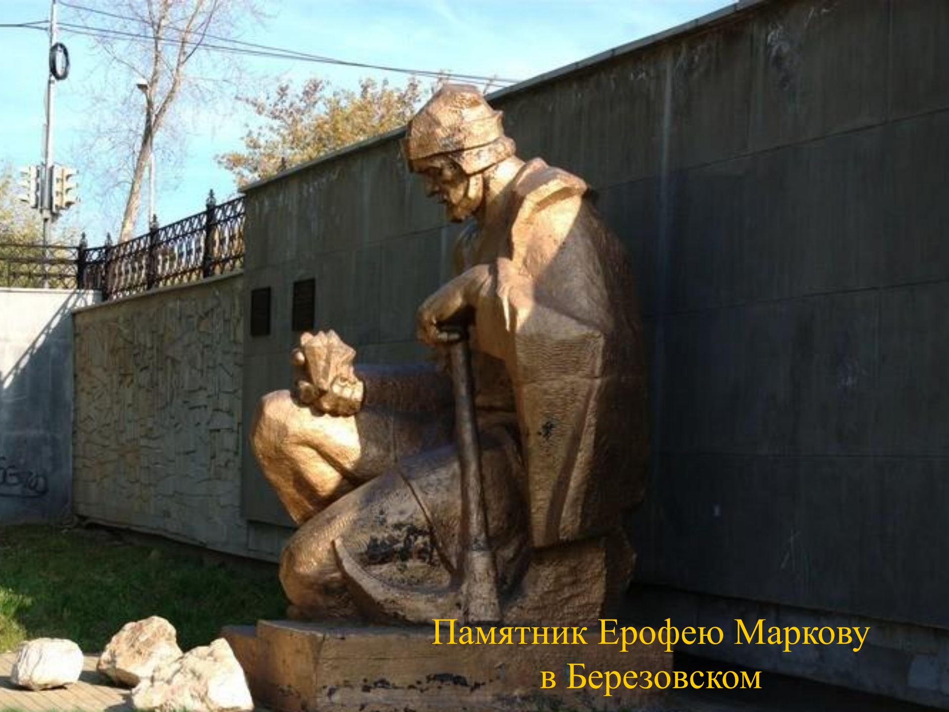
Памятник Ерофею Маркову в Березовском