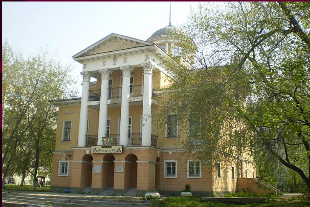
Усадьба архитектора М.П. Малахова (на улице Малышева)