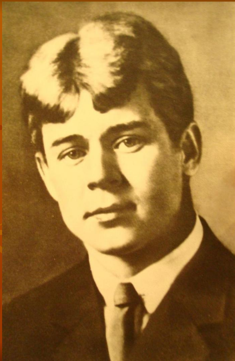
С.Есенин. 1922 г.