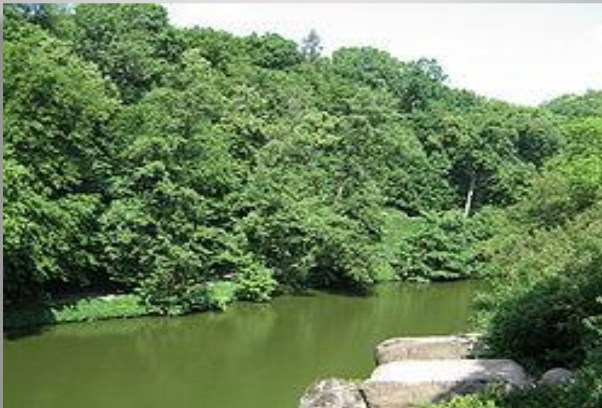
Вид на Нижнее озеро