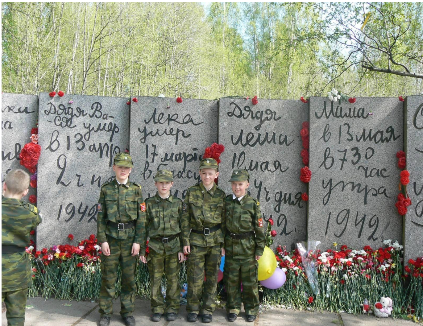
Памятник в Санкт-Петербурге