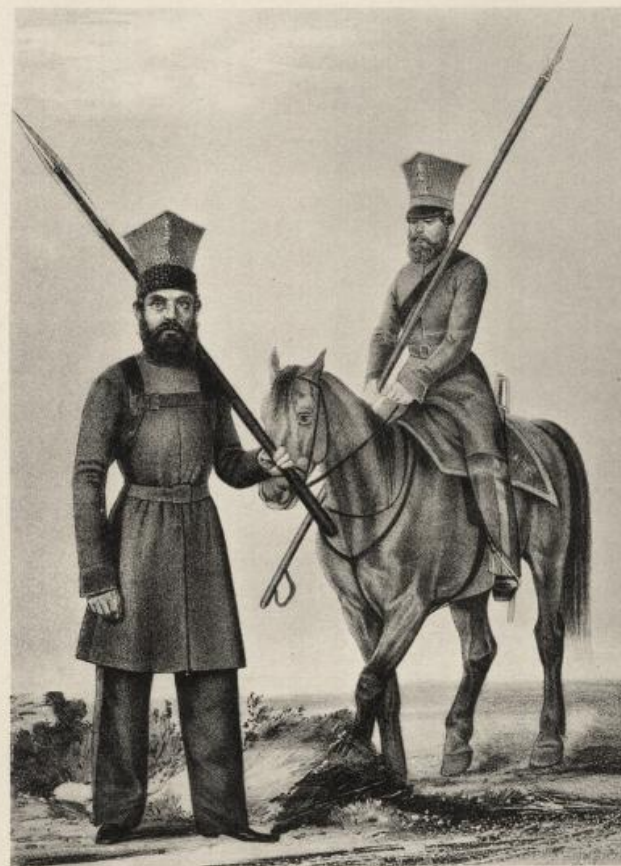
ПЕШИЙ И КОННЫЙ ВОИНЫ Нижегородского ополчения, 1812-1818.

9 декабря 1812 года Нижегородское ополчение в составе 5 пехотных полков и одного конного двинулось на Арзамас. В этом городе проходил смотр войск, а потом все ополчение в составе около 13 тысяч нижегородцев было направлено в действующую армию. Путь ополченцев лежал через Муром, Рязань, Орел - на Украину.