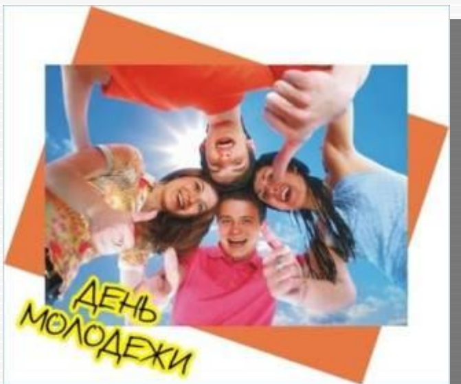
Год молодежи 2009 год