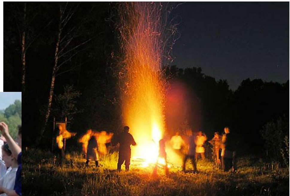
День Ивана Купала