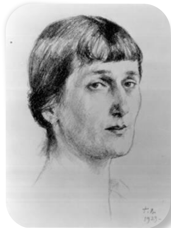
Верейский Г. С. Портрет А. А. Ахматовой. 1929