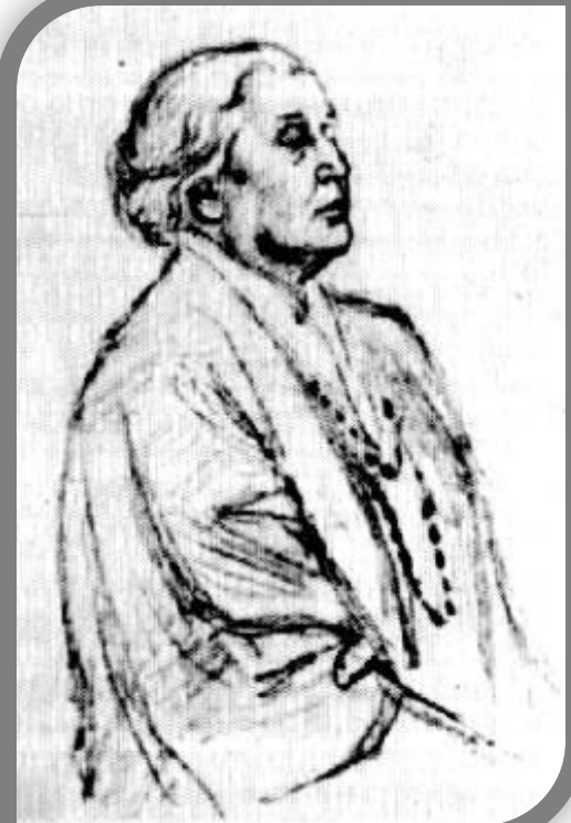
Фаворский В. А. Портрет А. А. Ахматовой. 1956