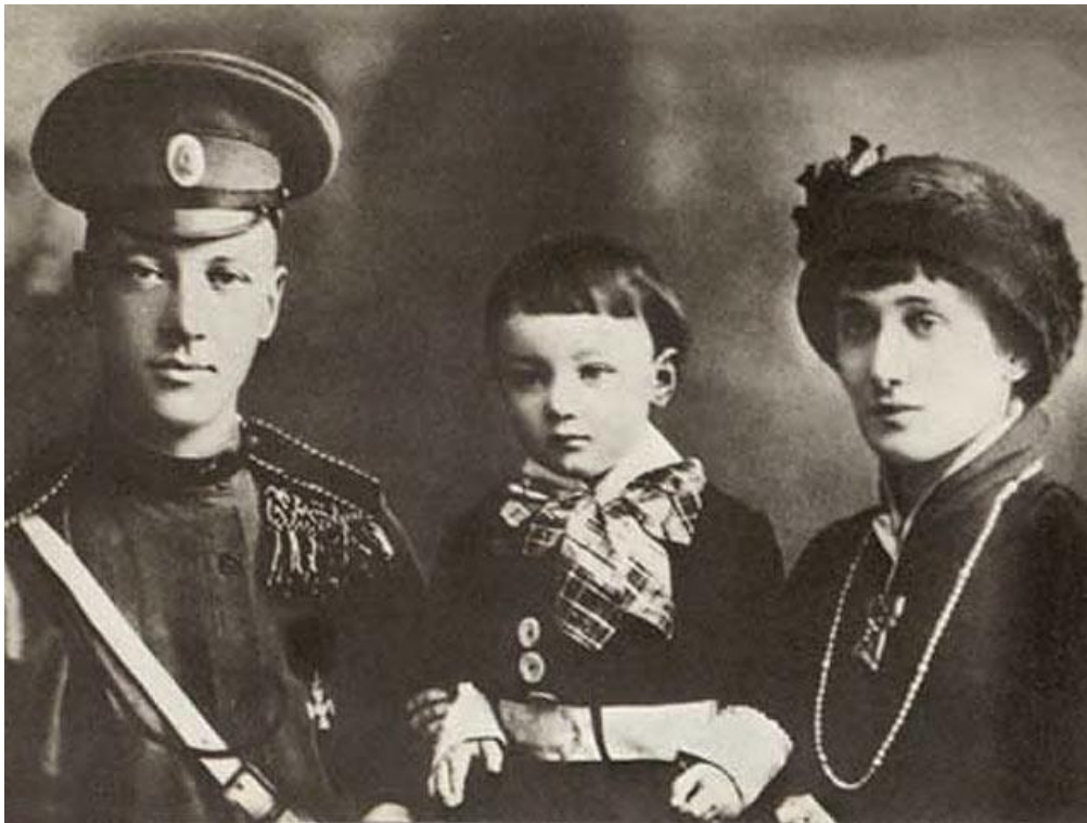
Николай Гумилёв, Анна Ахматова и их сын Лев

✓ посвящена жертвам сталинских репрессий