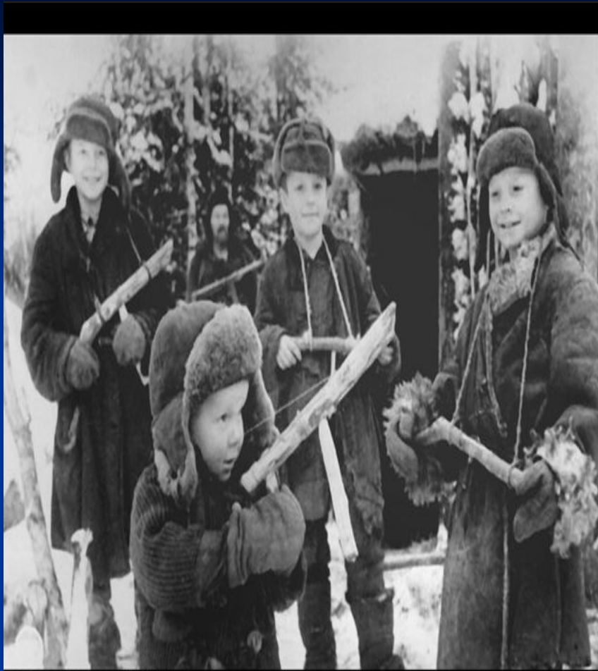
Репортаж из дня вчерашнего

22.01. У цю ніч 3-й сб 1235 сп переправився через р. Тясмин і заволодів південно-західною частиною с. Березняки. Відбивши кілька контратак ворога, закріпився на досягнутому рубежі. Ввечері ворог силою близько 200 осіб при підтримці сильного артилерійського вогню, 3-х танків, 2-х самохідок і 3-х бронемашин контратакував наші роти. В результаті важкого бою підбито два танки, самохідку і знищено десятки ворожих солдатів і офіцерів.