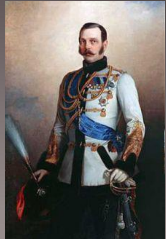
Портрет Александра II

Новые судебные учреждения создавались императорским манифестом от 20 ноября 1864 года. Там же подчеркивалось, что власть вновь создаваемых судов распространяется «на лица всех сословий и на все дела, как гражданские, так и уголовные». Сохранялся при этом, впрочем, и ряд особых судов — духовные, военные, коммерческие, волостные для крестьян и «инородческие». Гласность, устность и состязательность процесса — вот что отныне поднималось на щит.