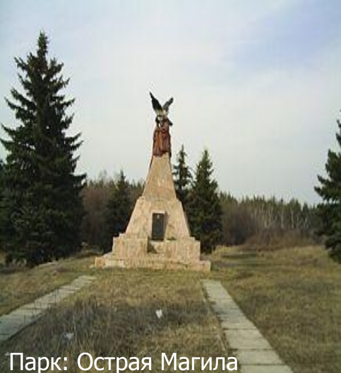
Парк: Острая Магила