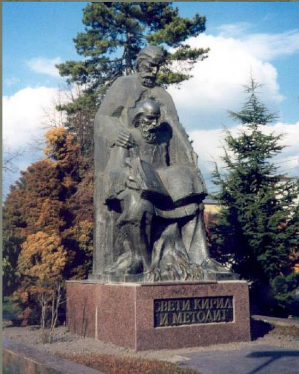
Македонија. Охрид. Паметник Кириллу и Мефодију