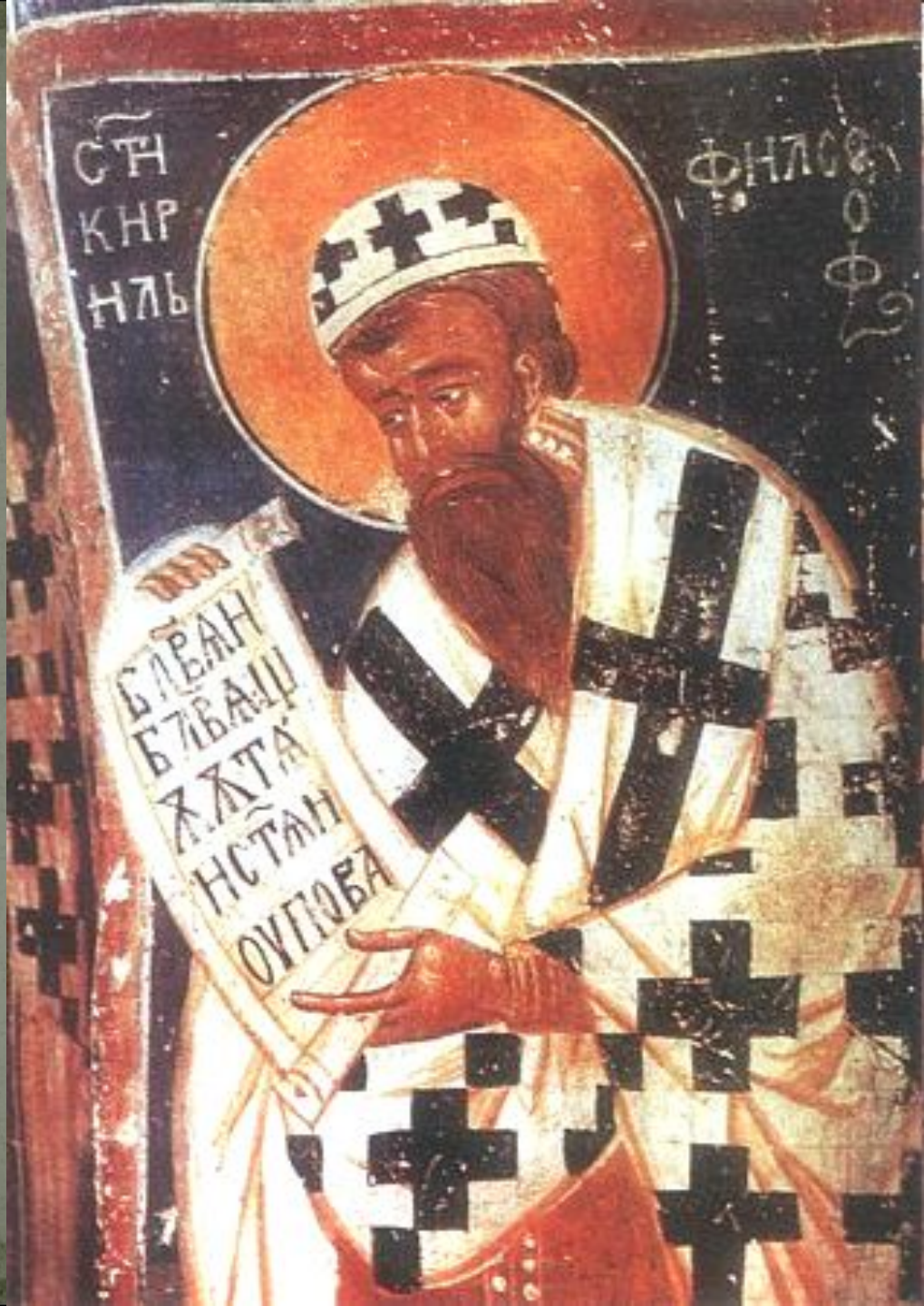
Святой Кирилл Философ. Болгарская фреска. XIII в.