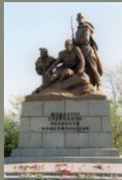
Памятник комсомольцам, погибшим в годы Великой Отечественной войны.