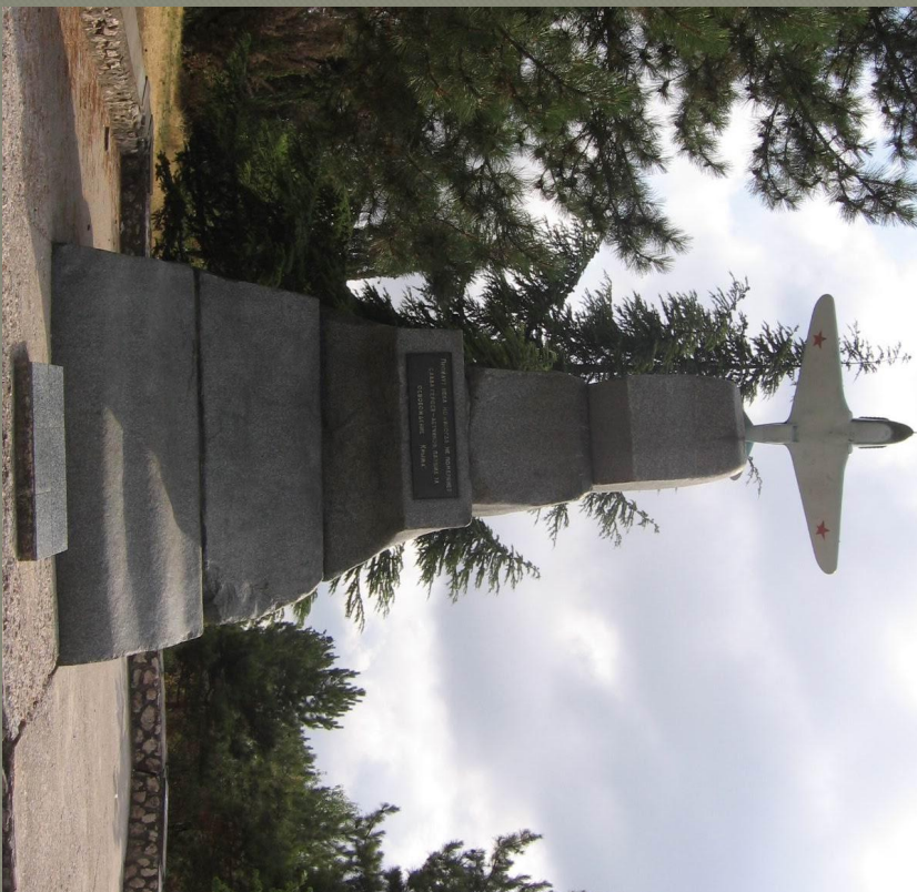
Памятник летчикам 8-й воздушной армии