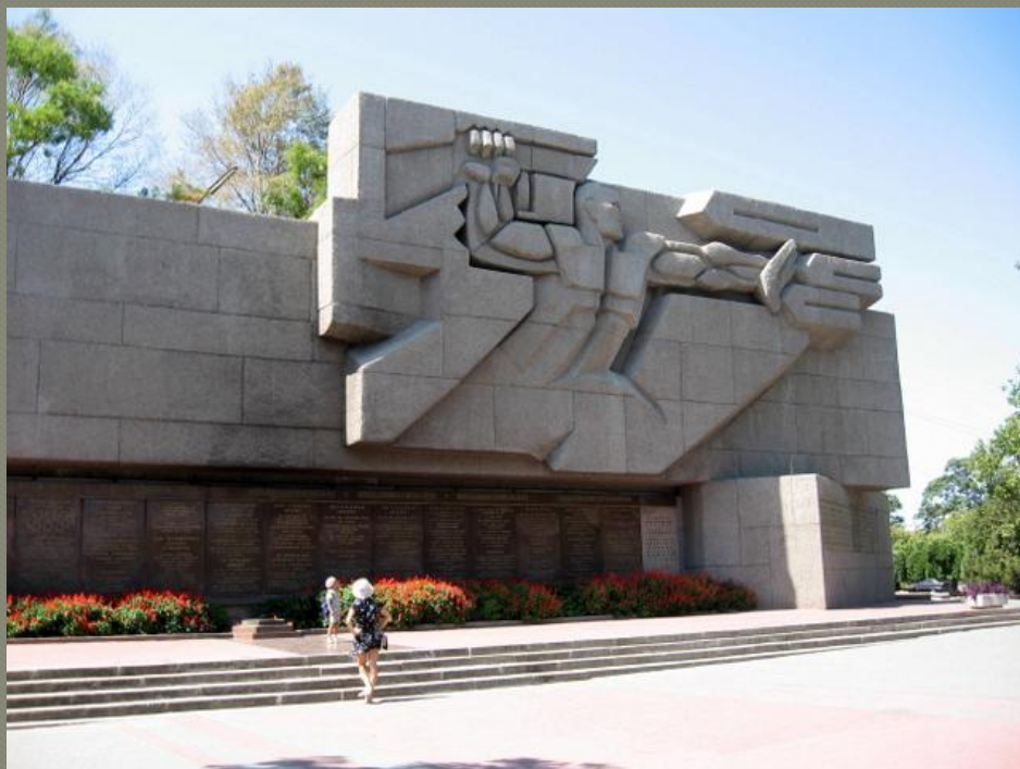
Монументальный памятник посвященный подвигу защитников Севастополя