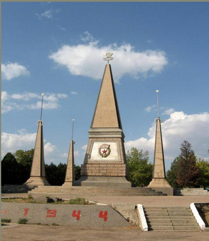
2 гвардейская армия