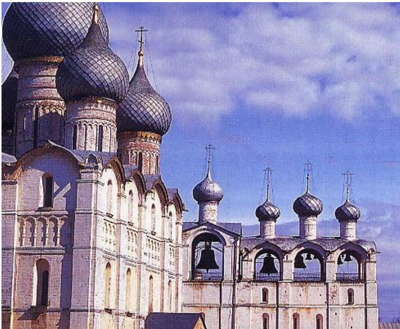
Это знаменитый пятиглавый Успенский собор.