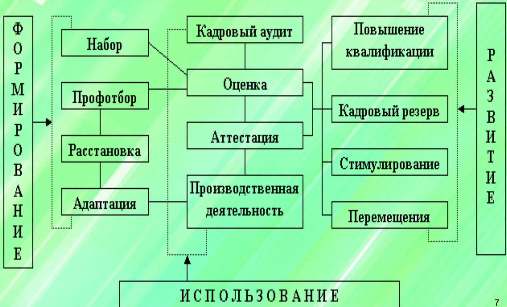
Схема кадровых процессов в организации