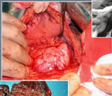
Поджелудочная железа больного алкоголизмом