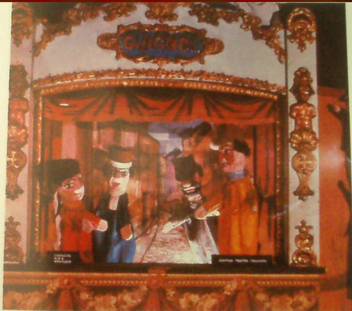
Ширма театра «Гиньоль» с народными кукольными персонажами.