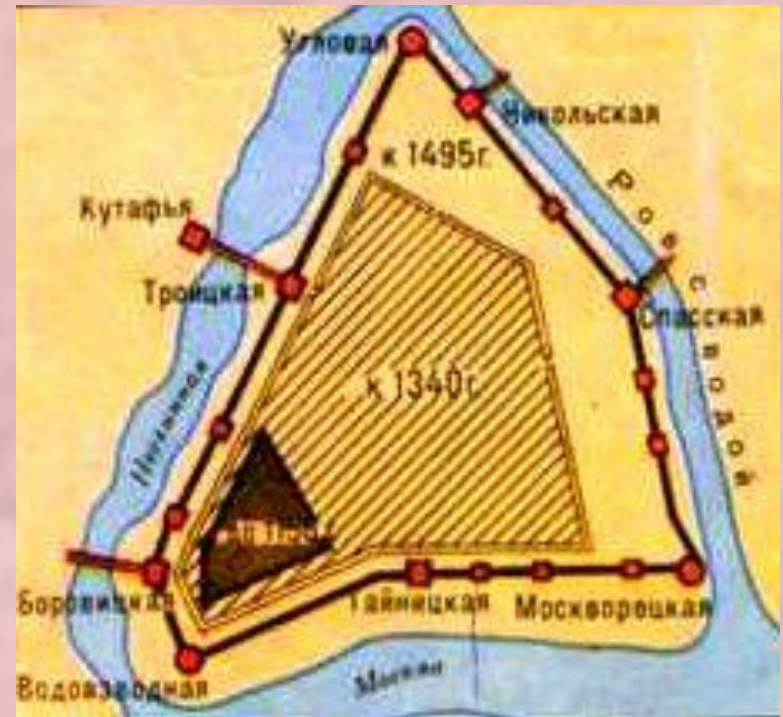
Схема роста Московского Кремля.

✨ Образование единого Российского государства во главе с Москвой привело к новому подъёму культуры. Началась перестройка Московского Кремля.