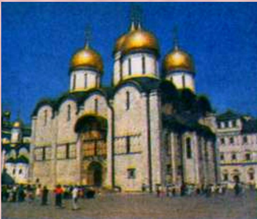
Успенский собор Московского Кремля. 1475-1479гг.