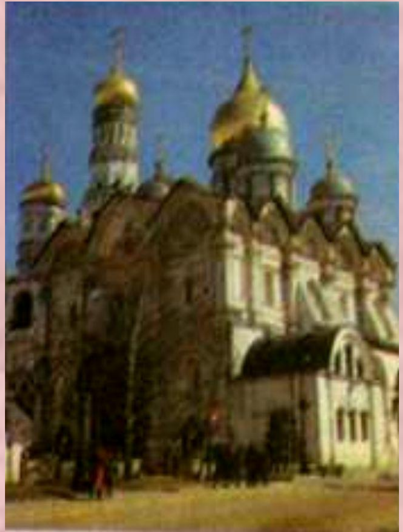
Архангельский собор Московского Кремля ★ Архитектор: Алевиз Новый.

Этот собор стал усыпальницей русских князей и царей. В нем покоится прах Ивана Калиты, Дмитрия Донского, Ивана Грозного, Михаила и Алексея Романовых.★