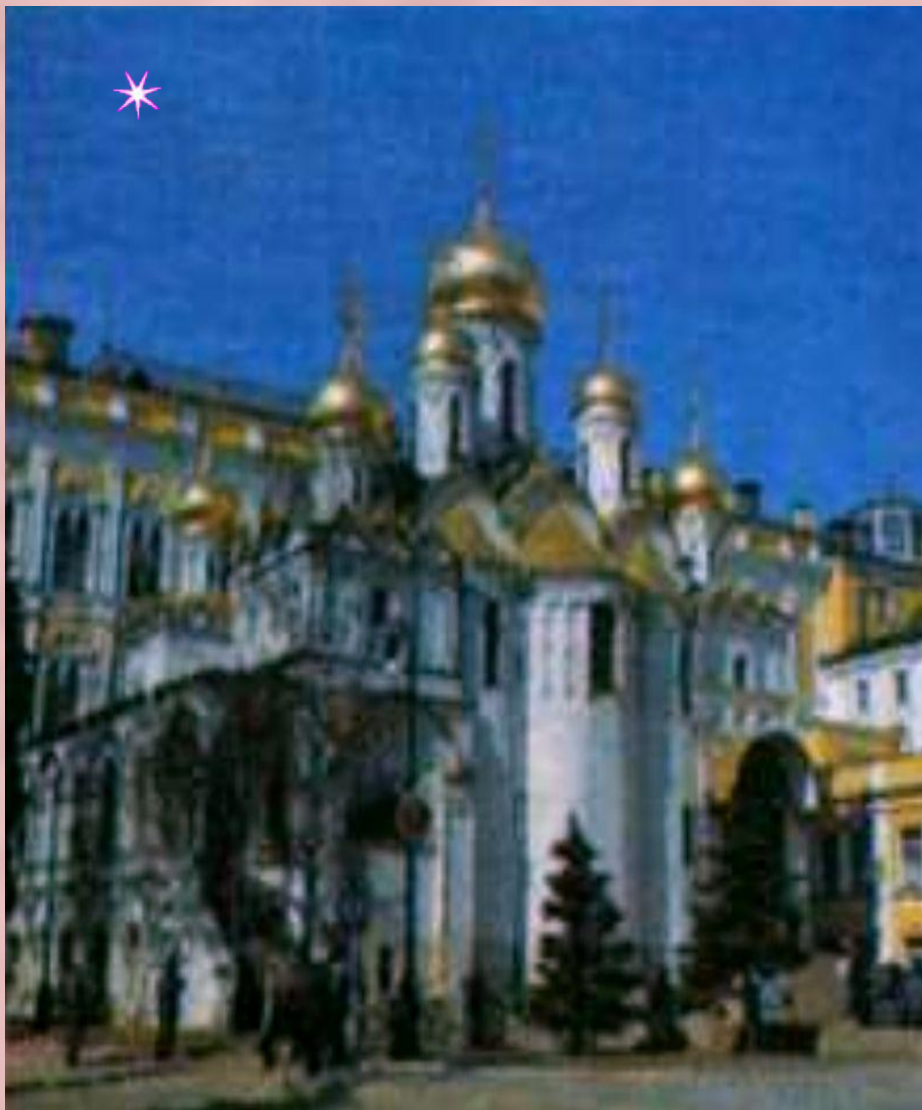
Благовещенский собор Московского Кремля.

★ ★ Благовещенский собор построен в конце 15 века псковскими мастерами, как семейная церковь великих князей. Иконы собора писал замечательный русский иконописец Андрей Рублёв. ★