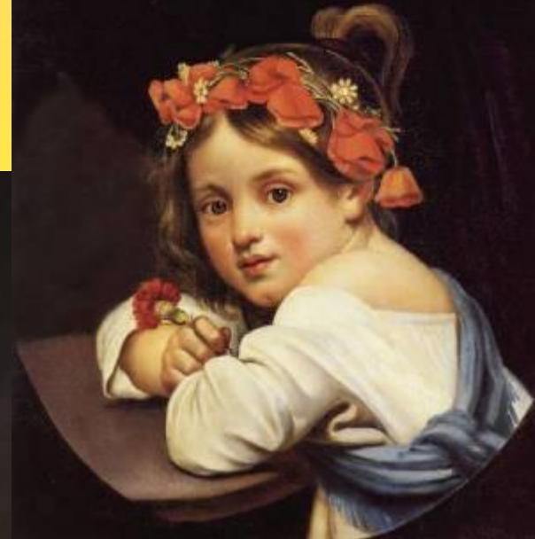
Девочка в маковом венке с гвоздикой в руке. 1819 г