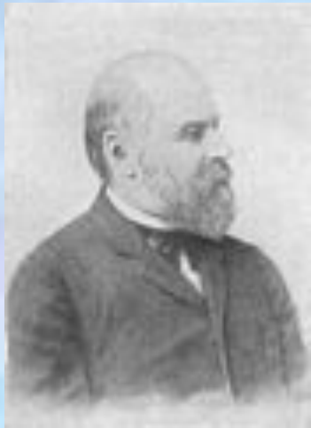
М. А. Балакирев

К середине 1870-х годов «Могучая кучка» как сплочённая группа перестала существовать. Деятельность «Могучей кучки» стала эпохой в развитии русского и мирового музыкального искусства.