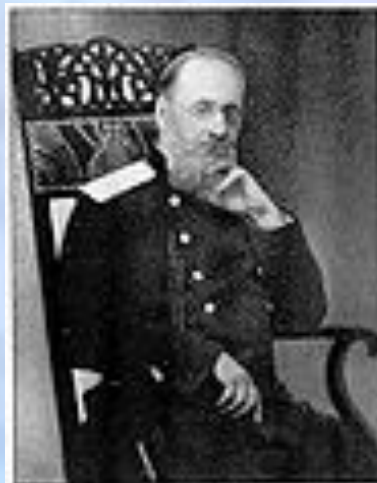
Ц. А. Кюи