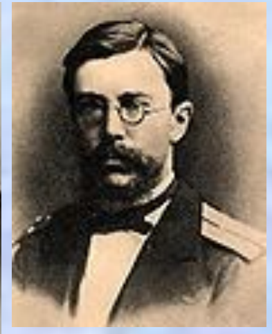
Н. А. Римский-Корсаков