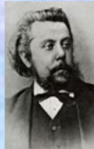
М. П. Мусоргский