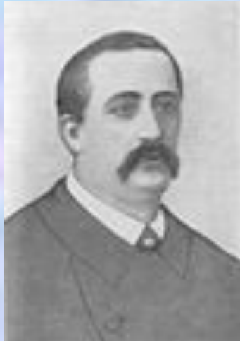
А. П. Бородин